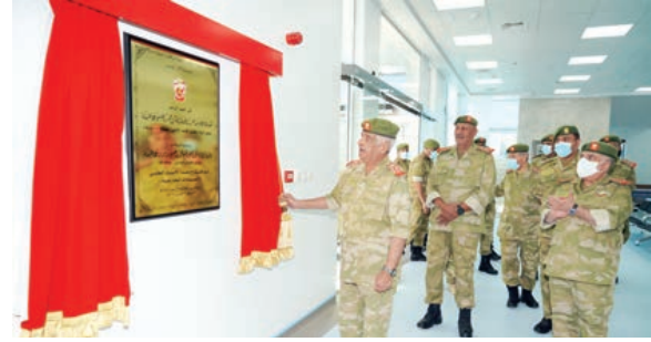
○ سمو رئيس الحرس الوطني خلال افتتاحه مبنى العيادات الخارجية.