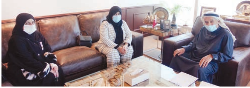
○ رئيس المجلس الأعلى للصحة يستقبل مجلس إدارة جمعية التمريض.